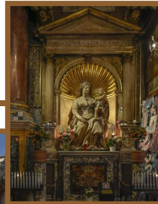
Madonna del Parto, Basilica dei Santi Trifone e Agostino, Piazza di S. Agostino, Roma